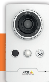
Caméra intérieure AXIS M1065-LW (3)

Homiris est un service opéré par EPS, leader de la télésurveillance en France*, qui protège vos locaux des risques d'intrusion. Vous retrouverez dans ce service tout notre savoir-faire. En vous proposant un équipement de qualité professionnelle conçu par la société Axis, leader sur le marché des caméras connectées, EPS vous fait ainsi profiter du meilleur de la vidéo [Source Axis 2020].